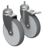
Ref.-Nr. 26076, 26077